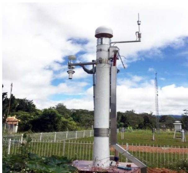
Hình 2. Một trạm CORS thuộc mạng lưới VNGEONET.

Tuy nhiên, giá trị chuyển dịch của các ngày có sai số lớn do ảnh hưởng của nhiều yếu tố khách quan sẽ không phản ánh hết quy luật chuyển dịch của đới đứt gãy, mảng kiến tạo theo thời gian. Để có thể phân tích và tìm ra quy luật chuyển dịch của các đới đứt gãy, mảng kiến tạo dựa vào chuỗi thời gian, sử dụng các mô hình toán học để xác định được quy luật chuyển dịch theo mùa, xu hướng chuyển dịch theo năm ... [16].