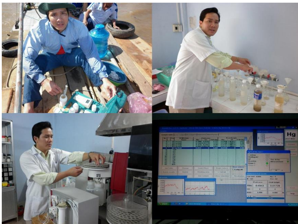
Hình 2. Thu mẫu, bảo quản, xử lý và phân tích hàm lượng Hg.