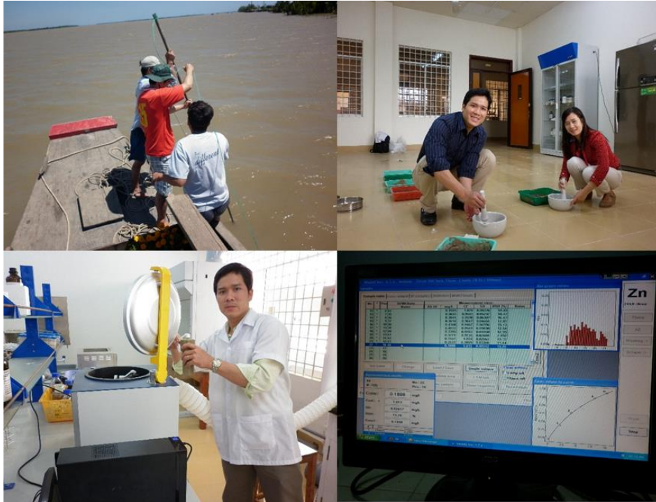
Hình 2. Thu mẫu, bảo quản, xử lý và phân tích hàm lượng Zn, Cu.

Mẫu được lấy cách mép bờ sông khoảng 70 m (nhằm tránh thủy triều cạn, ánh nắng mặt trời, hoạt động sản xuất con người, xác sinh vật,...), xuống sâu 20 cm (đây là tầng thể hiện rõ tích tụ ô nhiễm hiện tại). Tại mỗi địa điểm xác định trên bản đồ, tiến hành lấy 3 mẫu theo quy tắc tam giác cân, mẫu đại diện là mẫu được trộn và lấy từ 3 mẫu trên [2].